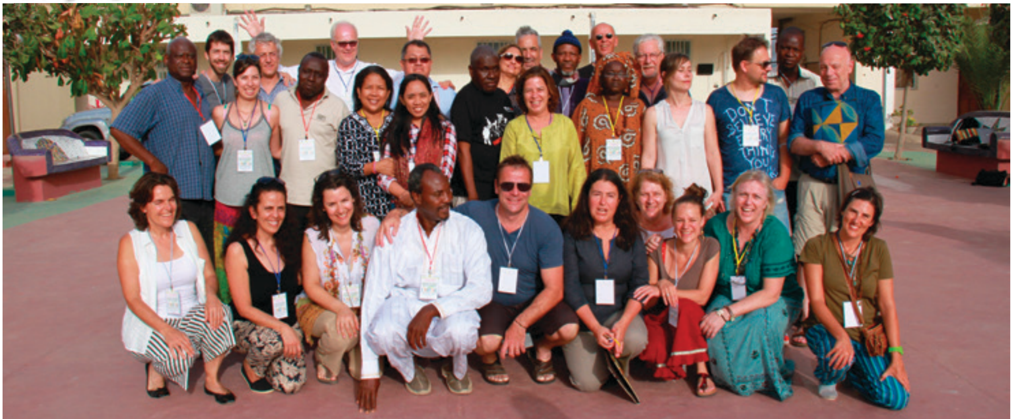
MEMBRE DU GROUPE PILOTE DE DYNAMO INTERNATIONAL STREET WORKERS NETWORK LORS DE LEUR DERNIÈRE RENCONTRE, SÉNÉGAL, JUILLET 2016

Nous partageons avec des professionnelles du monde entier des valeurs et des principes humains qui font du travail de rue une pratique unique et essentielle.